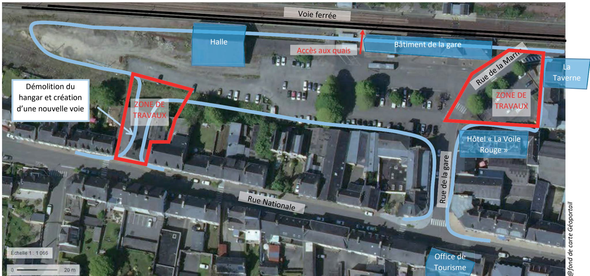
— Périètre du projet d'aménagement

CIRCULATION sur les rues : Circulation en demi-chaussée (rue de la Gare) ou fermeture ponctuelle de la rue la Marne – Voir ci-après.