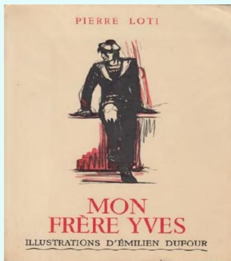
Couverture de Mon frère Yves , Editions Calmann Lévy, 1936

Rendez-vous : Remise du Moulin, face au Centre Culturel, près de l'étang.