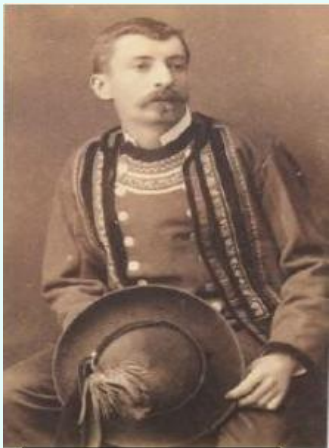
Pierre Loti en costume Mélenig