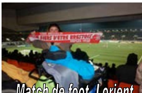
Match de foot, Lorient

Les sorties collectives (spectacles, festivals, cinéma, sorties nature, en mer...) ou individuelles organisées par la M.A.S. sont assurées par l'équipe, qui dispose de moyens de transports adaptés.